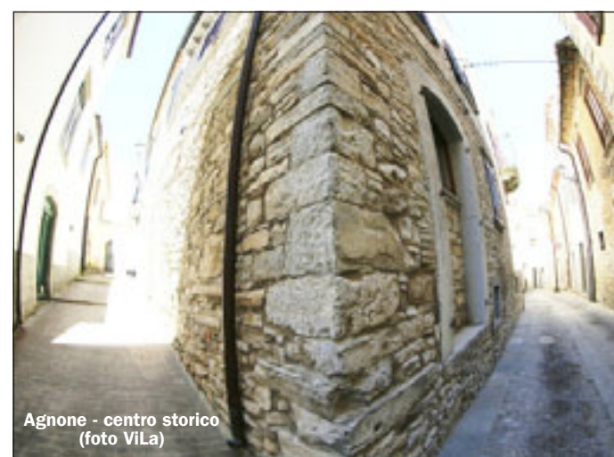
Agnone - centro storico